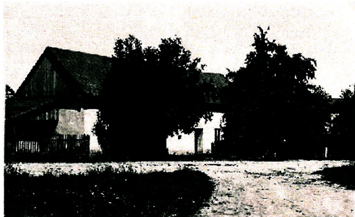
úkryt radisty a vysílače Blazice č.p. 51

i více jak čtyřem tisícům věrných spolupracovníků u příležitosti odhalení vzpomínkové tabule s účastí rodinných příslušníků parašutistů